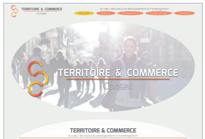
Flat Design - Responsive Web Design.