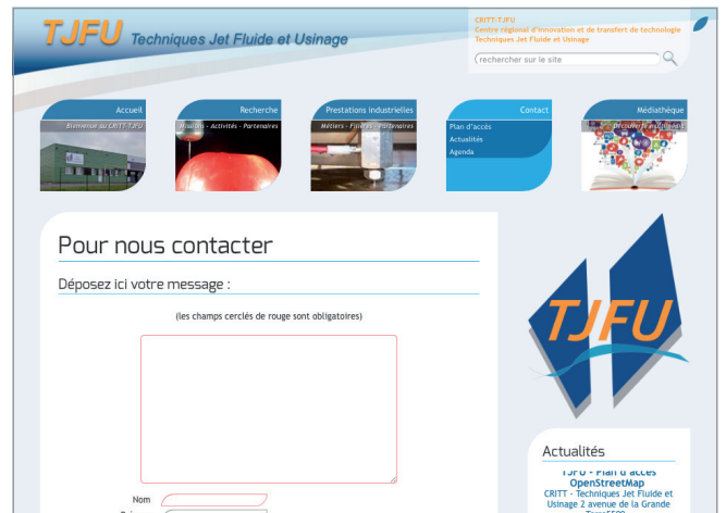
Colonne droite persistante - Formulaire de contact.